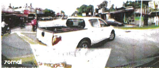
TANGKAP layar video memaparkan pemandu sebuah trak pikap menghalang laluan ambulans di Ketereh, Kota Bharu Khamis lalu.

"Justeru, kita meminta pemandu ambulans dan trak pikap