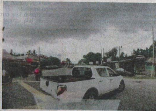
TANGKAP layar kejadian pemandu trak pikap menghalang laluan ambulans dalam kejadian di Kampung Padang Lembek, Kete- reh, Kota Bharu, Kelantan.

“Dalam Kaedah-Kaedah Lalulintas LN165/59 iaitu Kanun Lebuhraya ada menyatakan Peraturan 24 LN165/59 apabila menghampiri apa-apa kenderaan kecemasan seperti polis, bomba atau ambulans, bunyi siren atau loceng, tatacara pemanduan mestilah masuk ke sebelah kiri atau kanan dan berhenti untuk memudahkan laluan kenderaan kecemasan,” katanya dalam kenyataan di sini semalam.